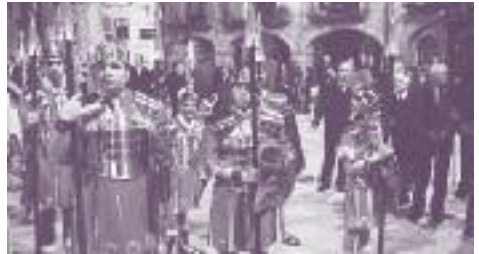
Submenú: Manaiés i estaferms