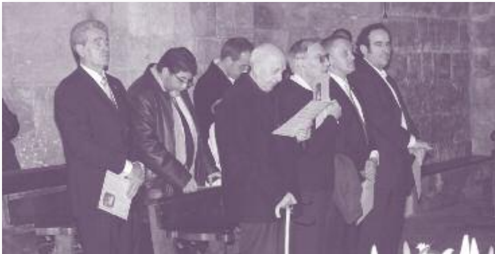
El bisbe emèrit de Girona, monsenyor Jaume Camprodon, ens acompanyà en la Cerimònia de Conclusió del Quinari.

menge de Quaresma, en la qual s'esmentava la intervenció de Josep Lagares al voltant de la restauració de la Dolorosa i de l'edició i muntatge de la pel·lícula El dia dels Dolors a Besalú .