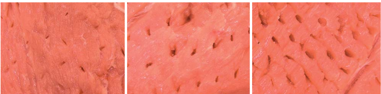
! Foto 3: Lotes T1 (Sables), T2b (Púas, a -10 mm) T3a (Cuchillas, a 0 mm) ! Photo 3: Batches T1 (Blades), T2b (Prongs, at -10 mm) T3a (Knives, at 0 mm)

Cohesion of the slices was evaluated by means of a Tensile Test undertaken in samples of 25 x 60 x 1.5 mm obtained from adjacent slices of cooked ham using a crosshead speed