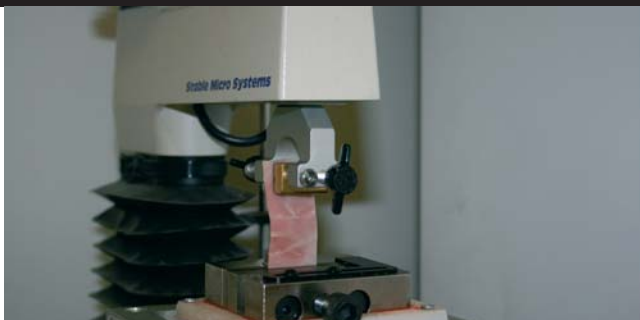
! Foto 4: Test de tensión mediante el Texture Analyser TA.TX2 (Stable Micro System Ltd) ! Photo 4: Tensile test with the Texture Analyser TA.TX2 (Stable Micro System Ltd)