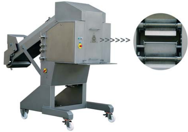
! Foto 2: Tenderizadora de cuatro rodillos, Filogrind Twin, Metalquimia, S.A. ! Photo 2: Four-roller tenderizer, Filogrind Twin, Metalquimia, S.A.

Rendimiento loncheado: Después de dos días de enfriamiento y estabilización del producto, se dejaron 2 horas en cámara de congelación y se procedió al rebanado en una loncheadora automática Weber 602, a 500 rpm, a un grueso de 1,5 mm, calculándose al final de cada pieza el rendimiento alcanzado. Al final de cada lote se realizó el promedio del rendimiento de todas las piezas loncheadas.